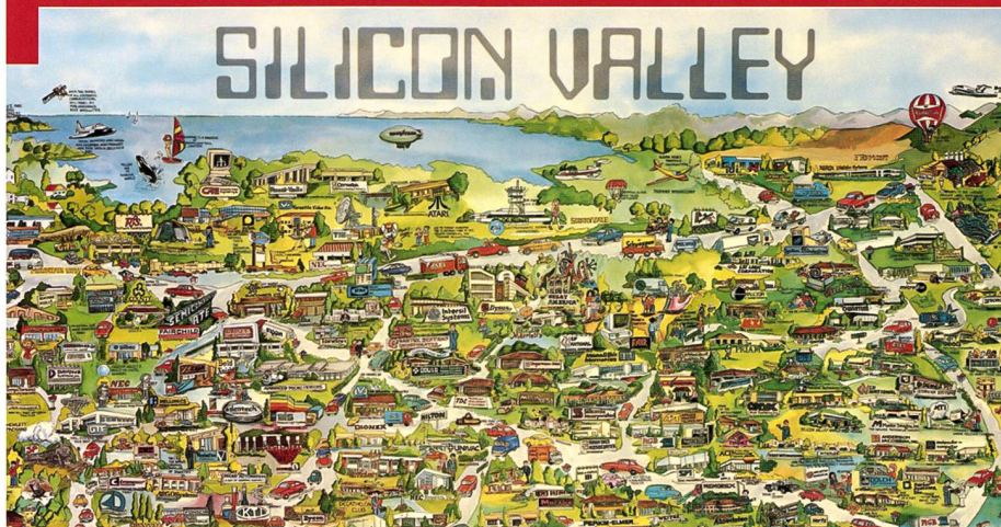
Portion of Silicon Valley map by Maryanne Regal Hoburg (1982).