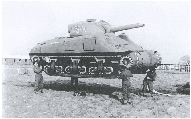
Un des simulacres de Sherman employés en 1944 dans le sud de la Grande-Bretagne pour induire en erreur le commandement allemand sur le lieu du débarquement...