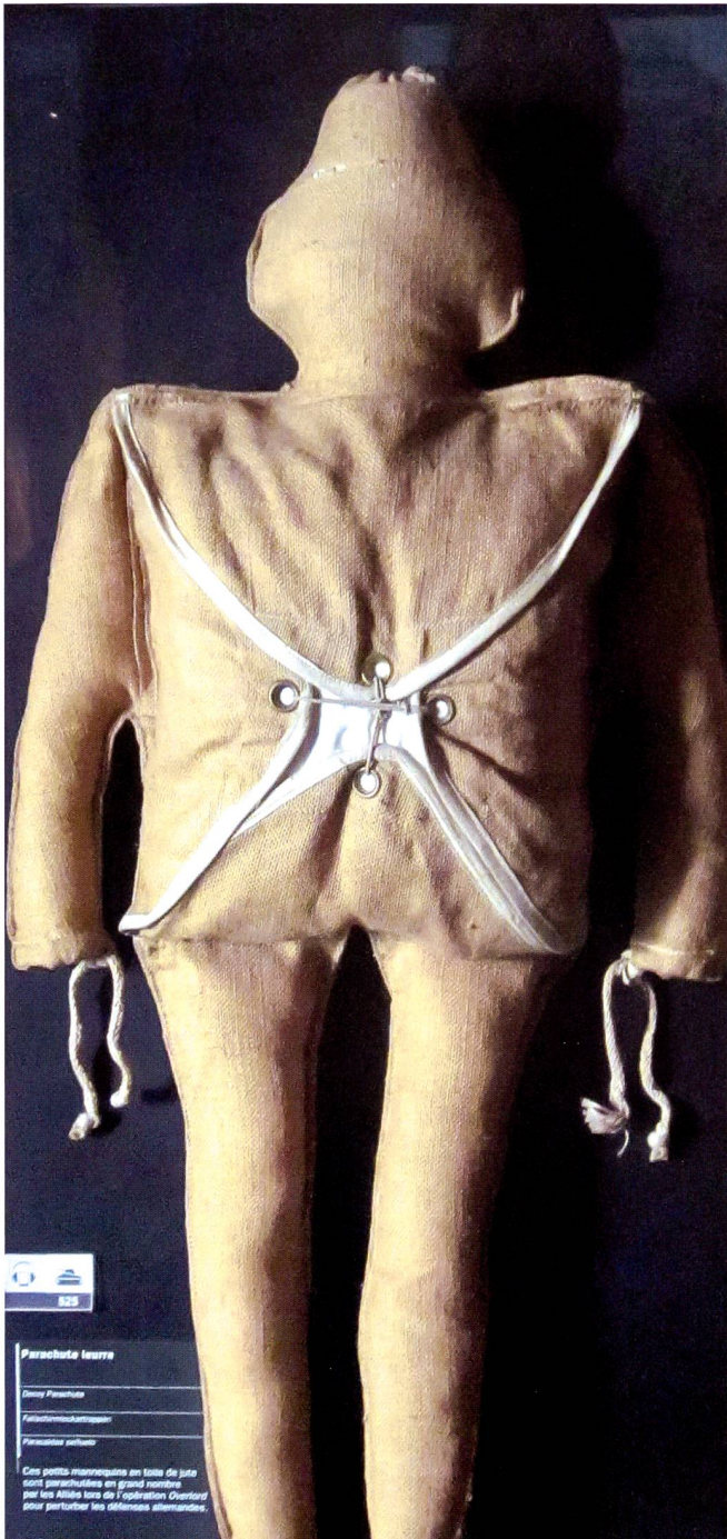
Le largage de poupées-parachutistes sur la Normandie, les 5-6 juin 1944, vise également à le perturber.

En 2009, des insurgés irakiens détournent des images non cryptées d'un drone Predator , utilisant le logiciel Skygrabber disponible sur le marché pour 26 dollars. Cela leur permet d'identifier les zones peu ou pas surveillées par les Américains. En 1997, le Hezbollah réussit à hacker le retour vidéo d'un drone des forces spéciales israéliennes, il sait ainsi où aura lieu la prochaine opération. Le Gouvernement chinois semble utiliser des drones camouflés en oiseaux pour surveiller la population, de drones-pigeons, tellement réalistes, qu'ils peuvent voler au milieu d'autres oiseaux sans être repérés.