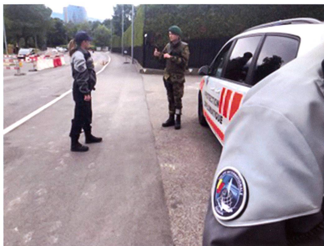
Contacts et échanges d'informations entre une patrouille d'ASP et les militaires en faction devant des missions nécessitant des mesures de sécurisation.

Le lundi 18 mai 2020, un premier désengagement partiel de l'armée sur le dispositif AMBA CENTRO a eu lieu et, depuis le 17 juin 2020, la police internationale a repris l'entière responsabilité des missions AMBA CENTRO, avec la démobilisation complète de l'armée.