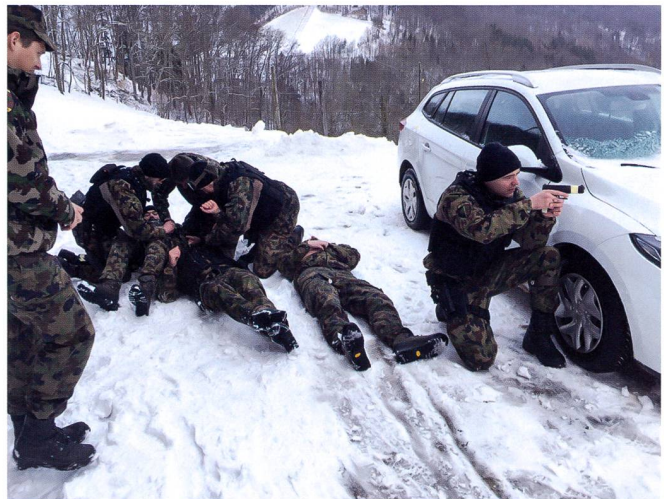
Ci-dessus : L'instruction se focalise sur les techniques et tactiques de police de sécurité.

Lundi 2 mars, secteur Wangen an der Aare. Les soldats des cp entrent en service, un peu déboussolés par les mesures décidées. Les accolades habituelles de retrouvaille font place à un certain inconfort. Tout le monde connaît la situation, tous ne l'ont pas encore pleinement appréhendé. À cette date, « seulement » onze cas sont confirmés en Suisse. Les cadres sont sur place pour garantir l'application des mesures de distanciation. Un soldat annonce avoir séjourné récemment en Lombardie. Il est immédiatement isolé ainsi que onze autres camarades avec lesquels il a eu du contact. Trois autres soldats sont envoyés au centre médical régional pour y effectuer un test de dépistage. Seul le test du soldat rentrant de Lombardie s'avéra positif.