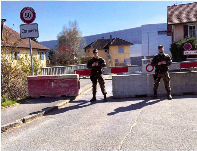
L'engagement commence le vendredi 27 mars 2020 et durera jusqu'au 7 avril 2020.

l'échelon supérieur, le médecin de bat ira même jusqu'à prescrire au sein des unités une séparation jusqu'à l'échelon du groupe, afin d'empêcher que toute une unité ne voie sa capacité opérationnelle diminuée. Ses mesures, aussi drastiques qu'elles puissent paraître, permettent au bat de contenir la propagation du virus et aucun autre cas ne viendra perturber la suite du service.