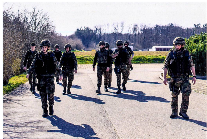
Ci-dessous : Les grenadiers et soldats de sûreté de la Police militaire sont formés au sein de l'Ecole PM 19 à Sion.

L'Armée s'y attendait. Elle est le miroir de la population et les conditions de vie y sont particulières. On dort à l'étroit, sous terre, on mange et travaille ensemble dans des espaces parfois confinés. Tout en évitant de dramatiser la situation, le commandant de bat décide de placer les soldats exposés dans une infrastructure militaire sommaire sur la place de tir du Spittelberg. Un jeune lieutenant se porte volontaire pour conduire le détachement « quarantaine ». Ces soldats doivent aussi être instruits et la marche du service ainsi que l'instruction sont organisées de manière simple et efficace. Ce nouveau cantonnement est rustique, mais parfait pour cette phase, à bonne distance des localités environnantes et au milieu d'une place de tir. Le détachement passera dix jours sans contact physique avec le reste du bat, à l'exception des éventuelles visites du médecin de bat, en tenue de protection complète, pour effectuer un suivi de l'état de santé des hommes du détachement.