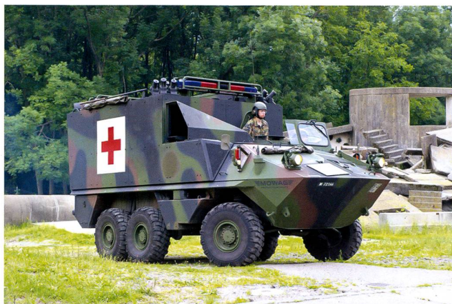
Le véhicule sanitaire blindé permet le transport de patients hors du secteur d'engagement sous protection d'un blindage léger.

Spécialistes ou généralistes? Etre chauffeur de camion est une profession. L'ambition de l'Armée est de former des jeunes dans une qualité qui leur assure la parfaite intégration dans le trafic et qui leur permette, s'ils le souhaitent, de postuler ensuite comme chauffeur professionnel avec le plus de qualifications possibles. Vouloir le faire durant les 12 semaines que dure l'instruction de base est ambitieux. L'instruction au métier de soldat se trouve donc réduite au minimum, ce qui consiste à avoir tout fait une fois, mais juste une fois. La recherche d'un équilibre est également à faire dans le domaine du recrutement: l'économie, qui est en manque de chauffeurs poids lourds, encourage l'armée à recruter comme chauffeur camion des jeunes qui seraient intéressés d'en faire leur profession. Quant aux commandants de troupe, ils préfèrent les jeunes issus de la paysannerie ou de la construction qui sont à l'aise avec leur camion dès les premières minutes. Finalement, le commandant d'Ecole de recrues a besoin d'un mélange équilibré qui lui permette également de recruter des cadres dans toutes les fonctions et dans toutes les langues.