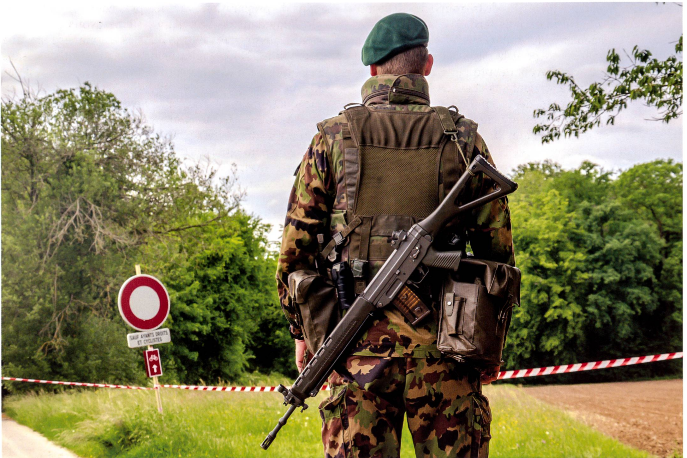
Une sentinelle attentive engagée sur la frontière verte est toujours prête à réagir.