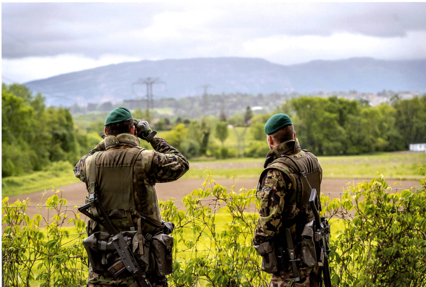
Deux loups du 19 surveillent la frontière verte au profit du Corps des gardes-frontière.