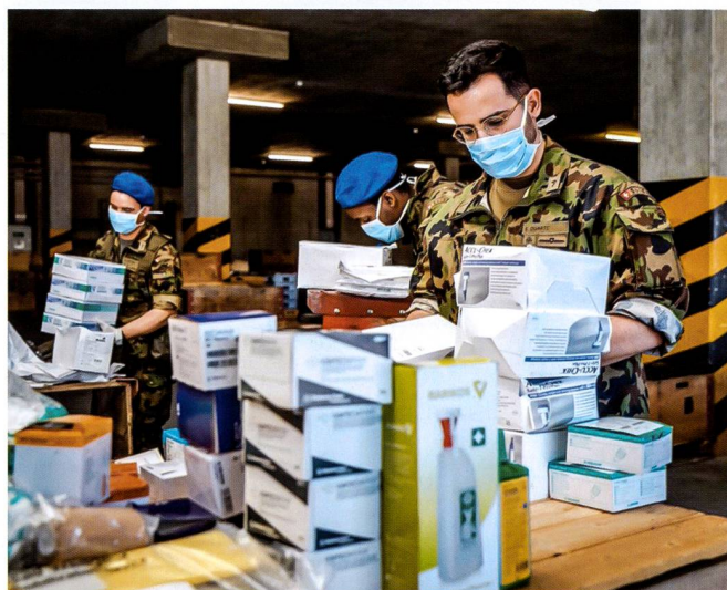
Ci-dessus: Mobilisation et instruction axée sur l'engagement pour le bataillon hôpital 2, sur la place d'armes de Bière, en mars 2020.

d'enseignements pour notre armée et fournit de bonnes bases pour la finalisation de son développement actuel (DEVA). Le système de milice a montré ses qualités et assez peu ses limites, ce qui est évidemment normal et réjouissant, car l'armée suisse peut bien plus que les seules capacités sanitaires et sécuritaires engagées. Elle a su générer un sentiment de confiance, ce qui est une base et une condition primordiale pour toute armée conçue pour être engagée principalement sur le territoire national. Enfin, il faut rappeler que nous n'avons engagé qu'une petite partie de nos capacités, et que l'armée est un système global, prévu pour assurer la défense du territoire national, dont la cohérence repose sur la somme de toutes les capacités disponibles ou en cours de développement.