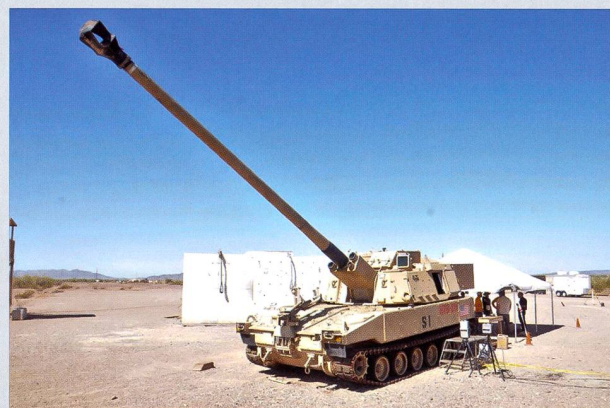
Ci-dessus : Le prototype armé d'un tube allongé, de 58 calibres. Les essais de tir ont été réalisés à Yuma, dans l'Etat d'Arizona.

Ci-dessous : Un M109A6 se met en mouvement, après avoir été déchargé dans un port néerlandais. On distingue à gauche des chars de combat M1 et à droite, un char de dépannage M88 et des véhicules de combat d'infanterie M2.