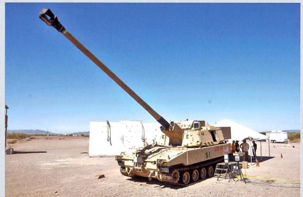
Ci-dessus : Le prototype armé d'un tube allongé, de 58 calibres. Les essais de tir ont été réalisés à Yuma, dans l'Etat d'Arizona.

Ci-dessous : Un M109A6 se met en mouvement, après avoir été déchargé dans un port néerlandais. On distingue à gauche des chars de combat M1 et à droite, un char de dépannage M88 et des véhicules de combat d'infanterie M2.