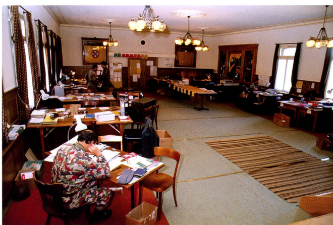
Ces images d'archive rappellent ce qu'ont été les exercices de « défense générale » au cours des années 1980.

terminée, cette culture des exercices à l'échelle nationale s'effaçait. L'exercice de conduite stratégique de 1992 a été le dernier exercice global Confédération-cantons. Les exercices de conduite stratégique effectués à partir de 1997 ne concernaient plus que le Conseil fédéral et les départements fédéraux ou leurs organes de crise.