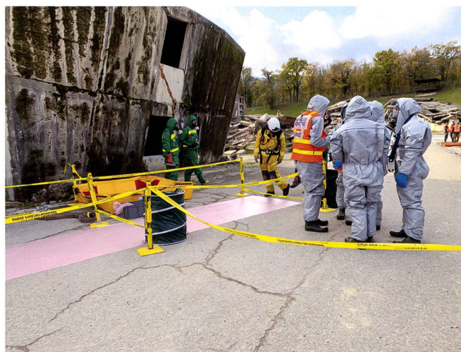
Spécialistes NRBC des sapeurs-pompiers professionnels de Genève (tenue verte) et de la France voisine (tenue grise) en tenue de protection. Contrôle de contamination du sapeur-pompier professionnel de Genève (tenue jaune) entre deux zones.