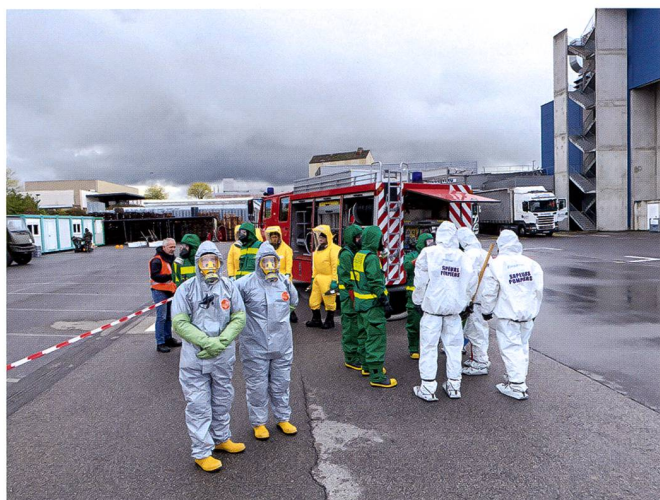
Spécialistes NRBC en tenue de protection de l'entreprise chimique (tenue grise), sapeurs-pompiers professionnels de Genève (tenue verte), sapeurs-pompiers professionnels de la France voisine (tenue blanche) ainsi que de l'armée suisse (tenue jaune).