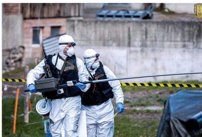
Ci-dessous : Une équipe de prélèvement d'échantillons en action.

En plus de la chaîne de détection décrite ci-dessus (prélèvement – collecte – détection forensique), des spécialistes sont formés dans le domaine de la spectrométrie in situ ainsi que dans le fonctionnement de portiques de radioprotection. Par spectrométrie in situ , on entend la mesure locale de la radioactivité du sol par des systèmes mobiles utilisables dans toute la Suisse. La mesure est effectuée directement sur place sans échantillonnage (dit in situ ). Les résultats de mesure peuvent être transmis immédiatement et traités ultérieurement par le LS. Les équipes mobiles responsables des portiques peuvent rapidement mesurer la contamination des personnes sur place dans toute la Suisse. Ces mesures sont particulièrement importantes en cas d'incident radiologique, car elles contribuent à la sécurité de la population concernée et créent la confiance. Compte tenu du spectre d'engagements décrit, il s'ensuit que le Lab déf NBC 1 peut être amené à devoir fournir, de manière extrêmement rapide, ses prestations déjà en situation normale, et pas seulement en cas de tension accrue ou de conflit. C'est pourquoi une compagnie et l'état-major du bataillon sont des unités de milice à disponibilité élevée (MADE), c'est-à-dire qu'elles peuvent être mobilisées dans un délai de 24 heures. De ce fait, un exercice de mobilisation est effectué chaque année au début du SIF.