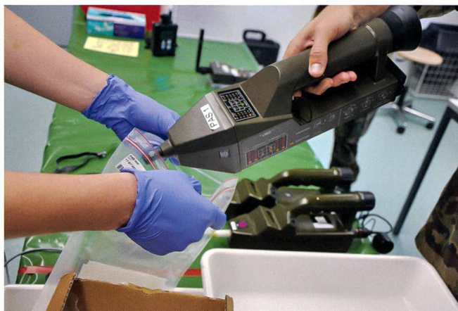
Ci-dessus : Contrôle au poste de collecte d'échantillons.

Les échantillons NRBC, qu'ils soient prélevés par des spécialistes du Lab déf NBC 1, du bataillon de défense NBC 10, de la compagnie d'engagement de défense NBC ou par des civils, ne sont jamais remis directement aux spécialistes du laboratoire, mais doivent d'abord passer par le poste de collection d'échantillons (PCE). Le PCE est un élément important de la chaîne de détection, il représente le point de transition entre le prélèvement d'échantillons «extérieur» et le travail de laboratoire «intérieur». Tous les échantillons livrés passent par le PCE et sont vérifiés pour s'assurer que la documentation les accompagnant soit complète, correcte et qu'ils ne présentent aucun danger pour le personnel. De plus, le PCE est le point d'enregistrement de tous les échantillons dans le système de gestion des échantillons du LS pour leur traitement ultérieur avant d'être remis aux spécialistes de laboratoire respectifs.