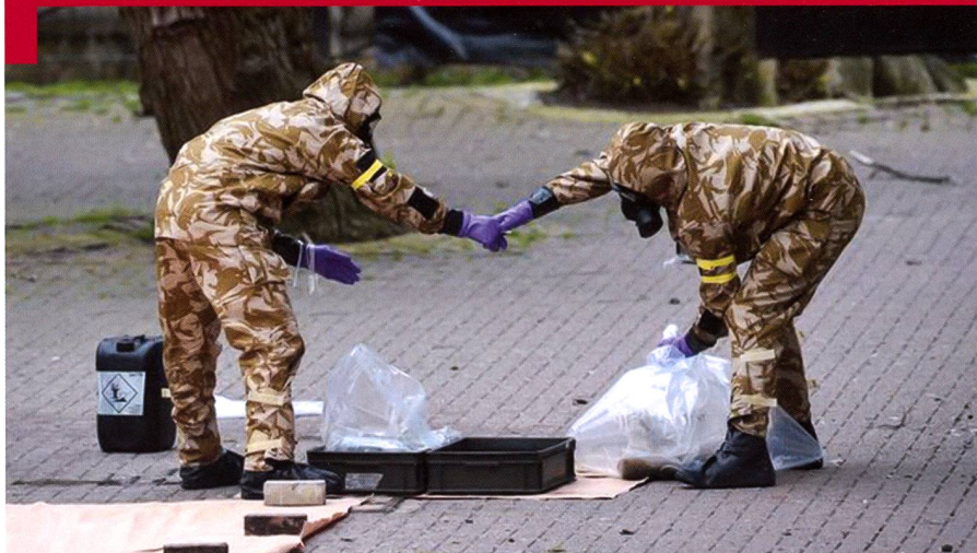
Des experts de déf NBC à Salisbury après l'attaque contre Sergei Skripal et sa fille. [ https://www.itv.com/news/2018-05-13/mi5-chief-says-salisbury-nerve-agent-attack-deliberate-and-targeted/ ]"