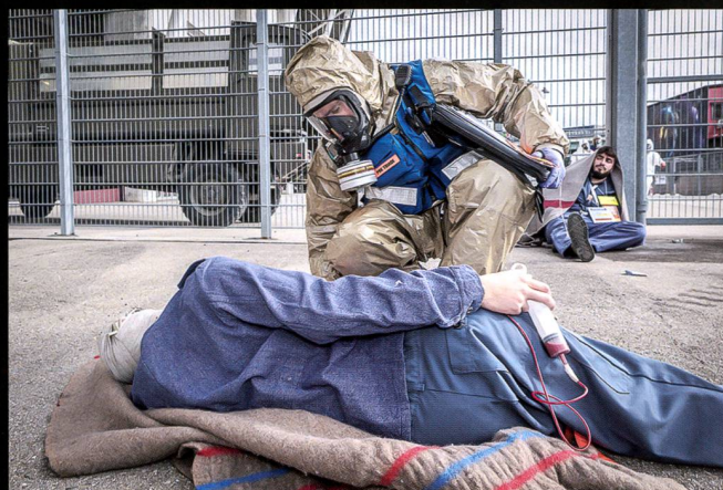
La compagnie de défense NBC 10/3 intervient en renfort avec ses moyens lourds et protégés, durant NRBC19 au stade de Genève.