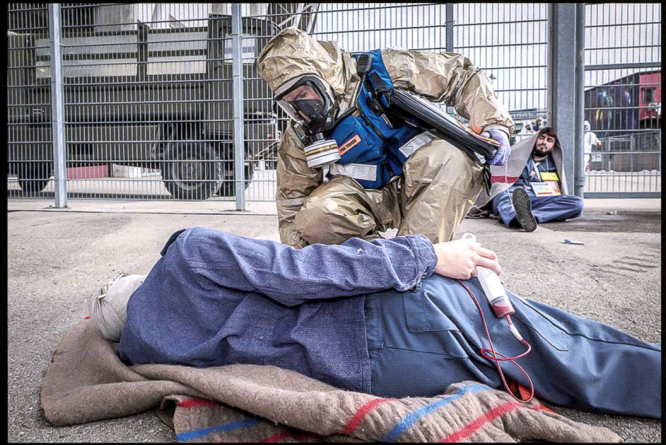
La compagnie de défense NBC 10/3 intervient en renfort avec ses moyens lourds et protégés, durant NRBC19 au stade de Genève.