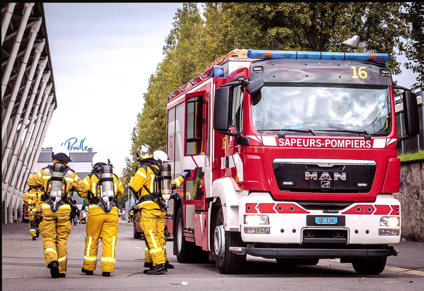
Engagement des pompiers professionnels du Service d'incendie et de secours (SIS) lors d'une des phases de l'exercice NRBC19 au stade de Genève, 8 novembre 2019.