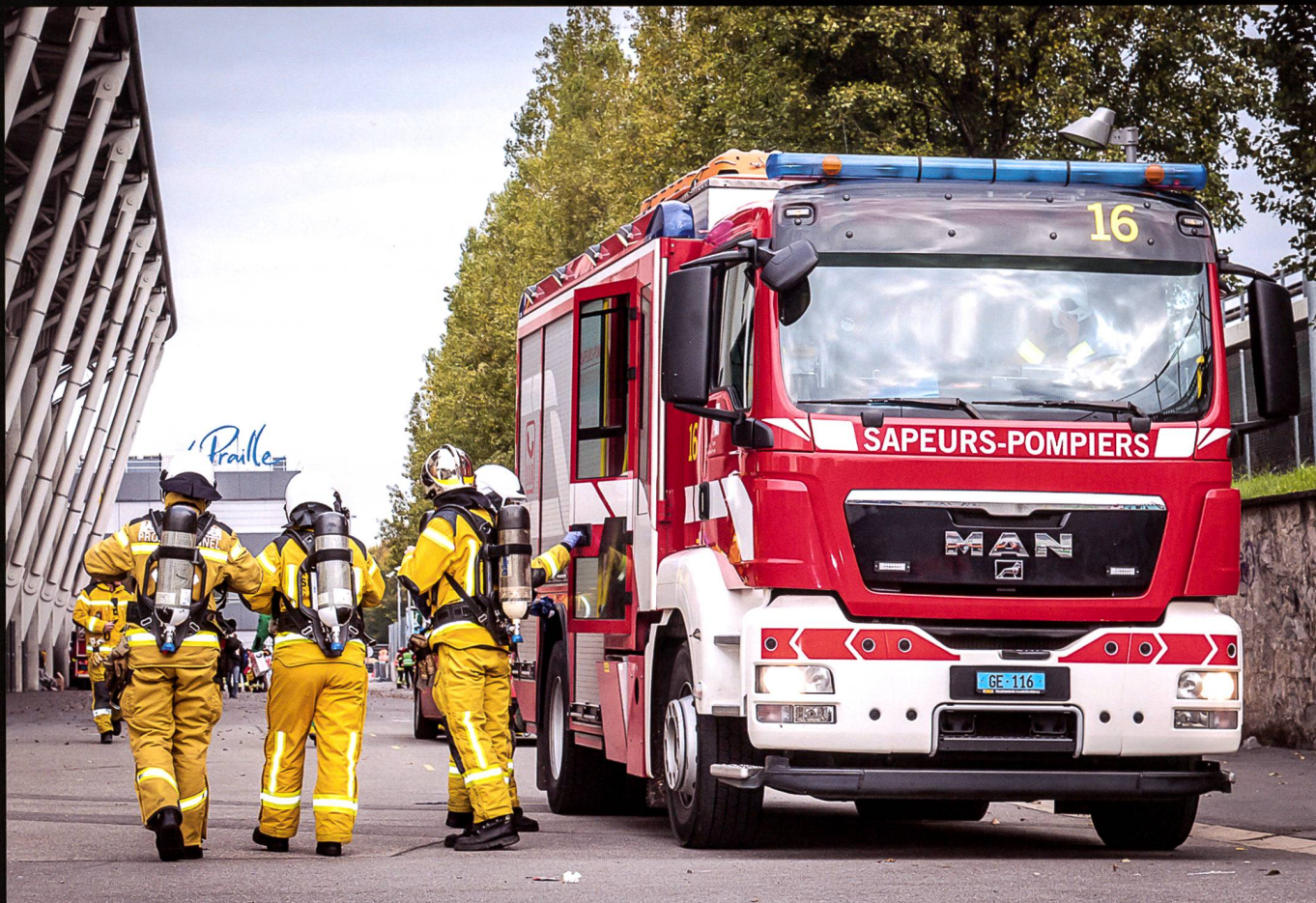
Engagement des pompiers professionnels du Service d'incendie et de secours (SIS) lors d'une des phases de l'exercice NRBC19 au stade de Genève, 8 novembre 2019. Toutes les photos © PIt Guillaume Weber.