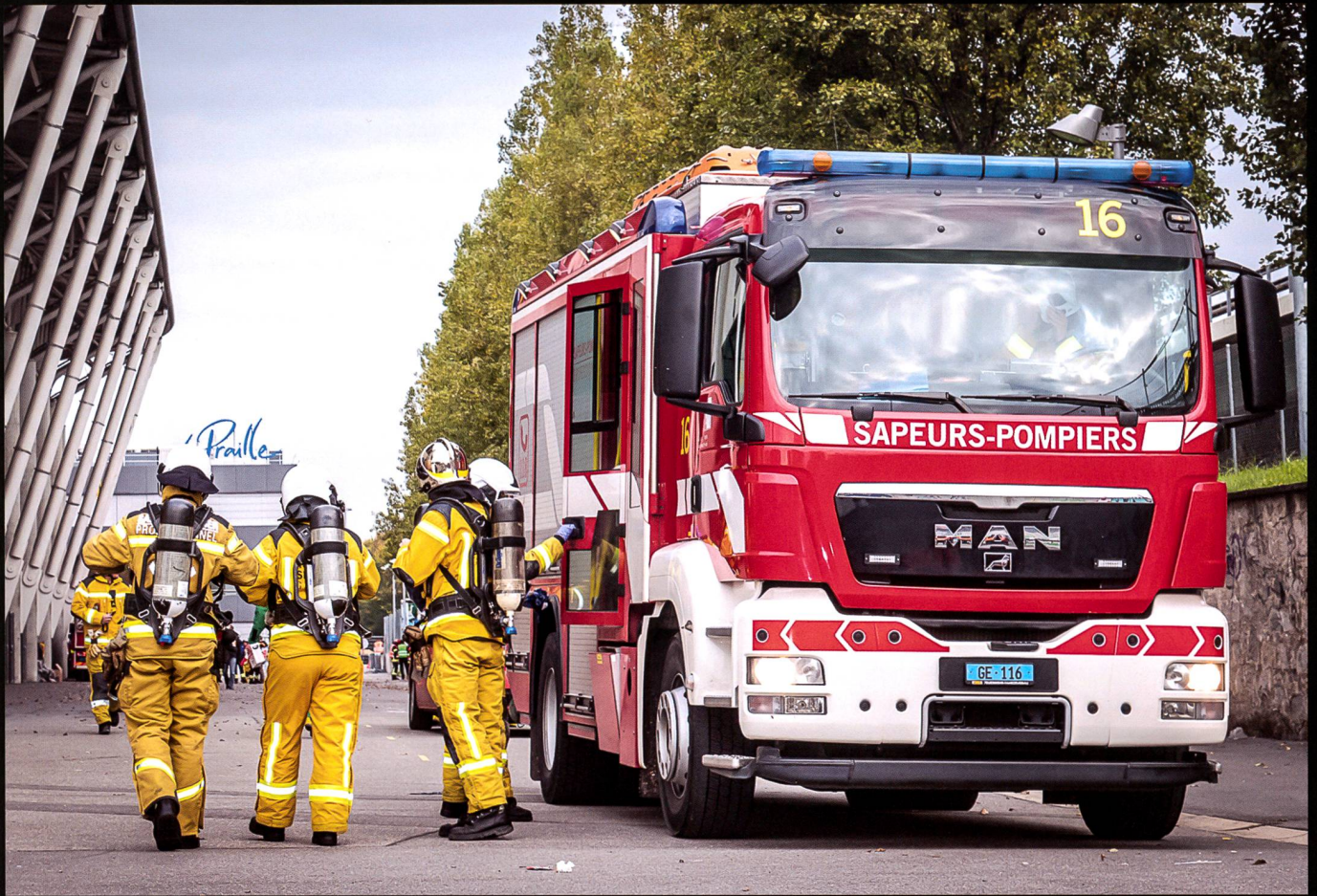
Engagement des pompiers professionnels du Service d'incendie et de secours (SIS) lors d'une des phases de l'exercice NRBC19 au stade de Genève, 8 novembre 2019.