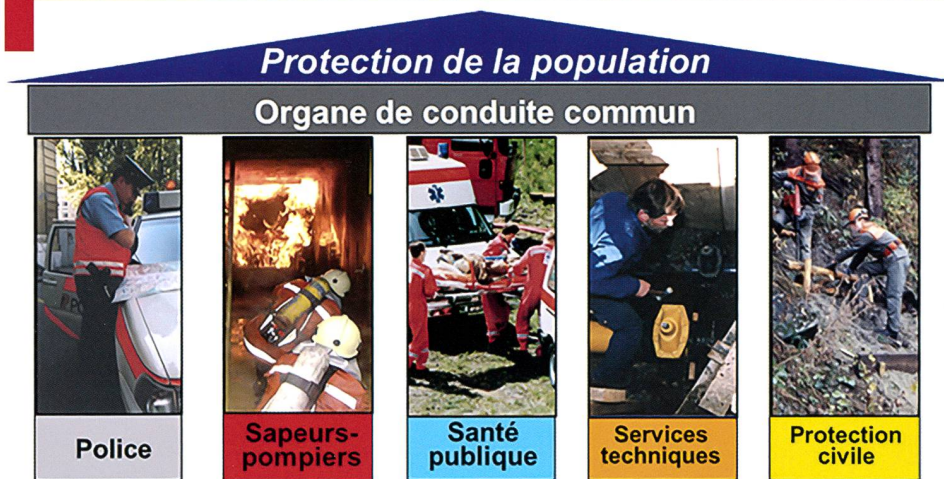
Ci-contre : Les cinq composants de la protection de la population.