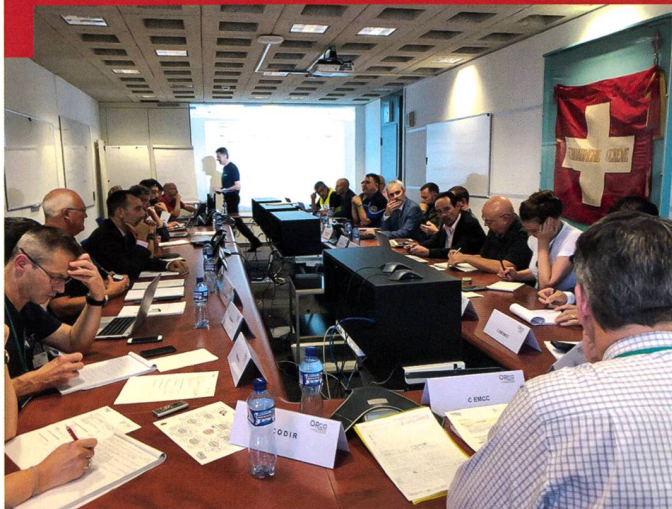
Rapport de situation de l'état-major cantonal de conduite (EMCC) genevois lors de l'exercice CONFINE TRE.