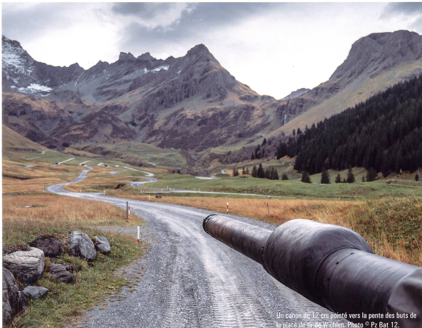
Un canon de 12 cm pointé vers la pente des butts de la place de tir de Wichlen.