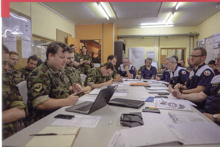
Groupe artillerie 1