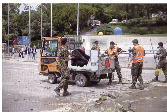
Lors de son déplacement sur Bière, pour effectuer sa démobilisation, le groupe d'artillerie 1 a consacré sa dernière semaine du cours de répétition 2018 à un engagement d'aide spontanée au profit de la ville de Lausanne, suite à d'importantes intempéries et dégâts d'eaux.