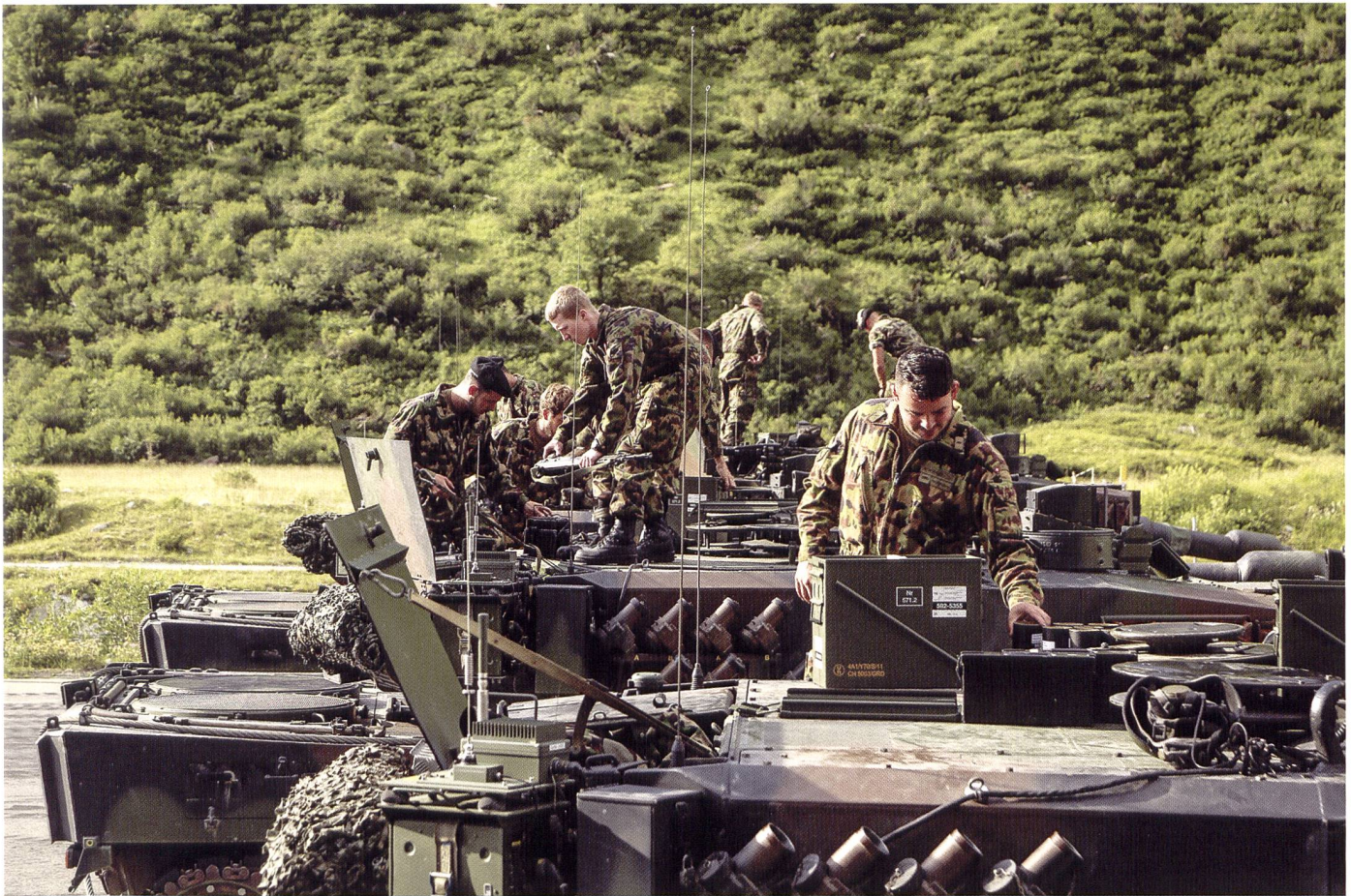
Les chars 87 Léopard de la compagnie de chars 1-2 sont amunitionnés durant la phase de préparation au combat. Avant le tir de munitions de guerre sur la place de tir de Hinterrhein, les équipages s'entraînent avec un tube réducteur de 27 mm.