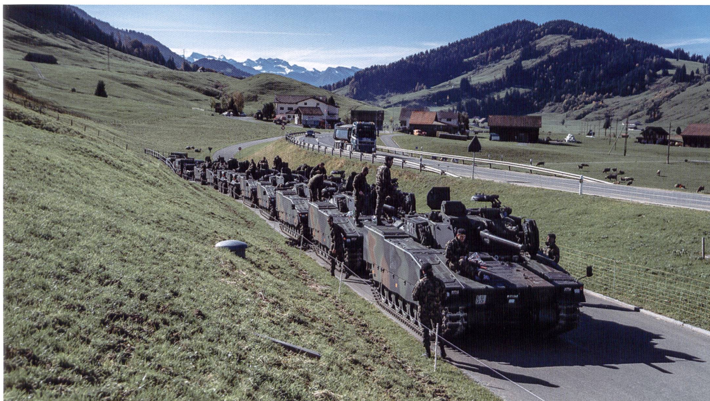
Ci-dessous : Halte de marche d'une compagnie de grenadiers de chars durant l'exercice GLADIUS.