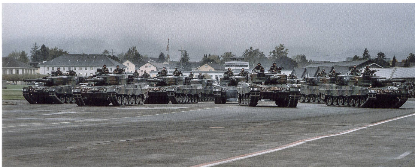
Ci-dessus : Défilé mécanisé organisé à l'issue de l'exercice de troupes GLADIUS.