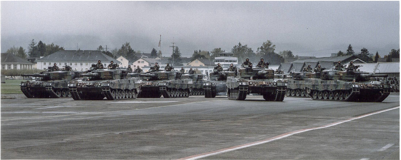
Ci-dessus : Défilé mécanisé organisé à l'issue de l'exercice de troupes GLADIUS.