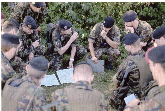
Donnée d'ordres et débriefing de l'exercice s'effectuent dans le terrain.