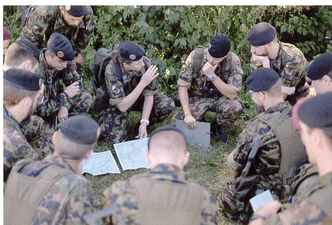
Donnée d'ordres et débriefing de l'exercice s'effectuent dans le terrain.