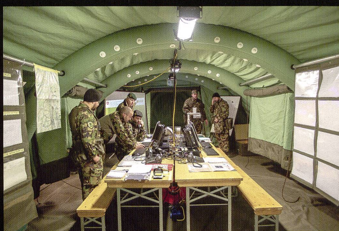
Ci-dessus : Prise de l'étendard du bataillon d'état-major. A droite et ci-dessous : L'exercice GROTTTO a permis d'entraîner les «bascules» entre l'échelon avancé de commandement (EAVC) et le poste de commandement mobile (PC mob), généralement installé dans une infrastructure protégée.