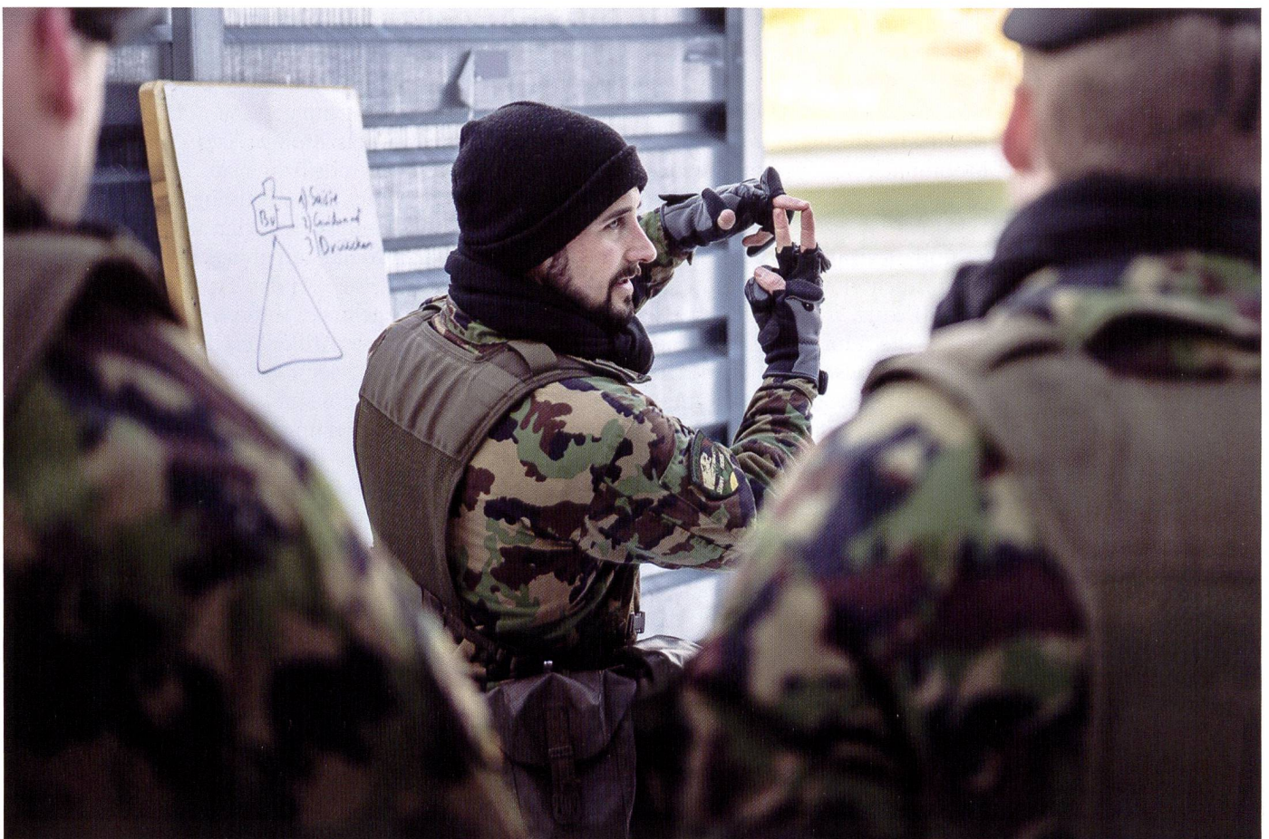
Ci-dessous : Instruction périodique à l'arme personnelle pour les cadres de l'état-major, à Thoun ou à Schwarzenburg.