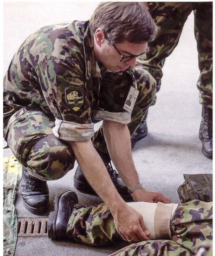
Ci-dessus : Le médecin de brigade est notamment responsable de la formation appropriée de l'état-major de brigade dans le domaine sanitaire.