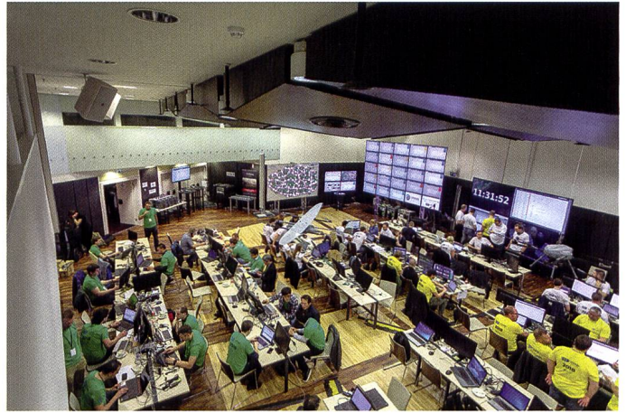
En avril 2019, la procédure a été utilisée pour la première fois lors de l'exercice LOCKED SHIELDS par la Swiss Blue Team. Cet exercice confirme que la méthodologie est très efficace pour détecter les attaques de l'équipe rouge en temps réel.

Afin de permettre à l'armée d'utiliser cette nouvelle méthode, le CYD Campus a travaillé en étroite collaboration avec la BAC ces derniers mois. Les nouvelles procédures ont été intégrées par des « Cyber-Sergents » dans les systèmes existants de la BAC et étendues de telle sorte que la détection des attaques avec les systèmes d'enregistrement réseau existants de la BAC fonctionne en temps réel