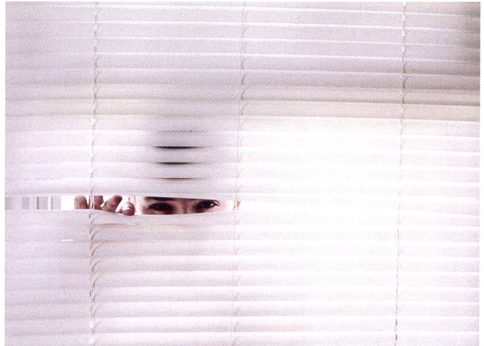
L'observation dans des lieux non publics nécessite une autorisation (art. 26 LRens)

Ces inspections ont permis d'établir 32 recommandations (Art. 78 LRens) et 30 suggestions (moins contraignantes) à l'intention du département responsable des services de renseignement, le DDPS, qui a décidé qu'elles devaient toutes être concrétisées. L'AS-Rens a notamment contrôlé l'utilisation faite des données par ces services et les opérations de renseignement. L'AS-Rens a décelé un potentiel d'optimisation dans divers domaines: elle a ainsi recommandé de procéder à des adaptations réglementaires dans le domaine de l'armée et de réviser une ordonnance en vue de préciser le processus de recherche des informations dans le cadre de l'exploration