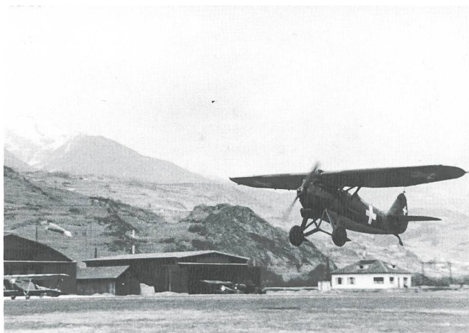
Dewoitine D.27 à l'atterrissage à Sion.

utilisée par la Police militaire, en particulier son commandement et son centre de formation, comme cela a été prévu par la planification du Développement de l'Armée.