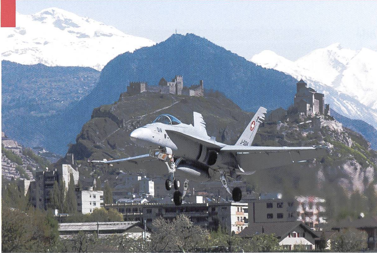
F/A-18 à l'atterrissage à Sion.