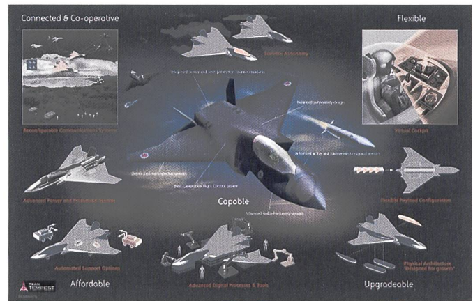
La vision britannique de la 6 e génération représentée par le Team Tempest .

La rupture de ces différents programmes se retrouvent déjà pour la plupart dans leur nom. Il s'agit essentiellement non plus de développer un avion mais un bien un système complet de guerre aérienne. Le besoin commun exprimé par les états-majors français et allemands qui est à l'aune