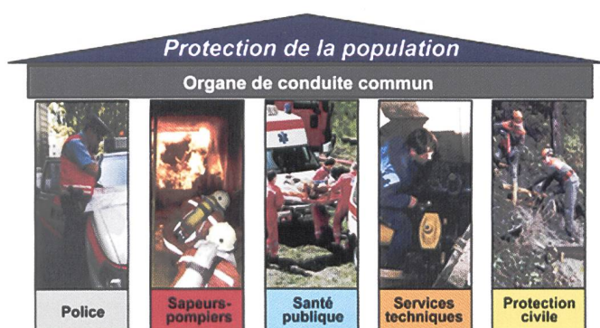
Les constituants de la "protection de la population".

stationnement leur a été délégué. Quant aux missions de transport de détenus, seulement ceux considérés non-dangereux, il permet à la police d'économiser 80'000 heures de travail.