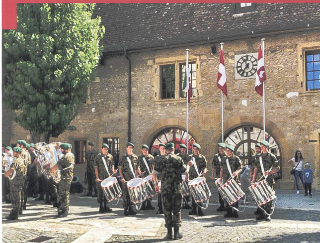
La partie officielle a eu lieu dans la cour du château.