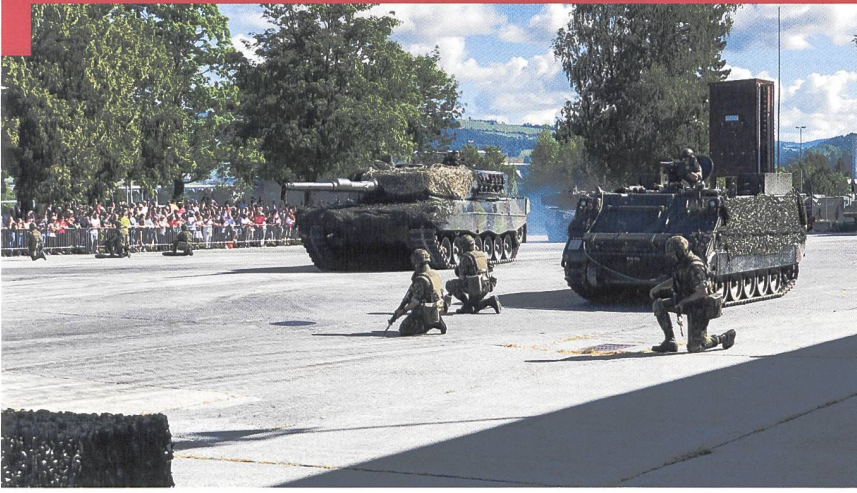
Démonstration de l'engagement d'une section de sapeurs de chars, ouvrant un passage obligé, aussitôt franchi par une section de chars 87 Léopard .