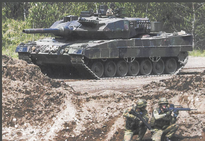
A gauche et ci-dessous : Le char de grenadiers Marder est encore bien présent dans la Bundeswehr. A droite : Léopard 2 A7 .