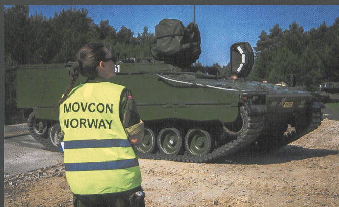
Ci-dessus : Véhicules de combat d'infanterie (VCI) Marder allemands et CV90 norvégiens.