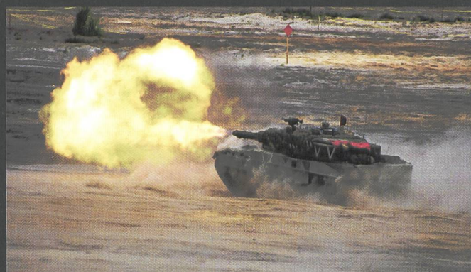
Ci-dessus : Les chars Léopard 2 A4 de la 11 e brigade blindée polonaise sont issus des surplus de la Bundeswehr.