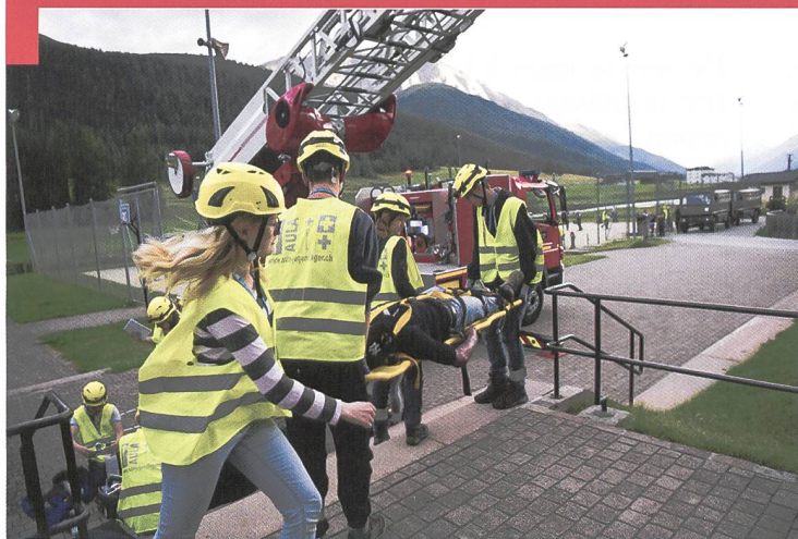
Un exercice d'engagement commun a lieu avec les services d'urgence locaux.