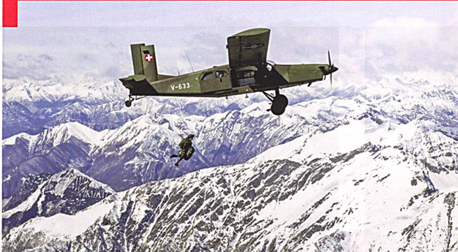
Saut en parachute depuis un Pilatus PC-6 Turbo Porter au-dessus des Alpes.