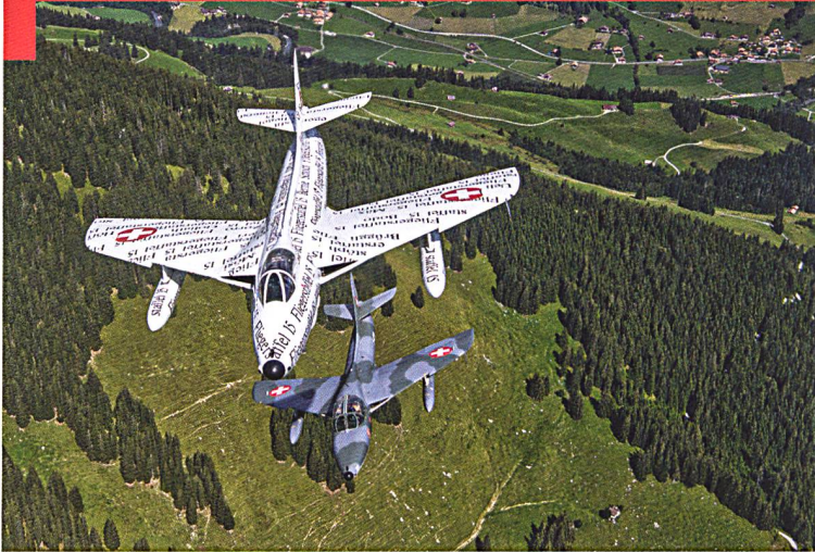
Un vol au-dessus des Alpes bernoises, qui rappelle avec nostalgie les années 1970.