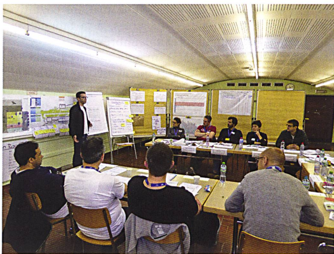
Ci-dessous : Présentation devant l'état-major.

Nous devons utiliser ces formations de conduite, car elles sont uniques dans leur genre. Dommage qu'encore trop de cadres de notre économie ne connaissent pas cette offre et en font usage – cette information-ci doit ouvrir l'avenir.