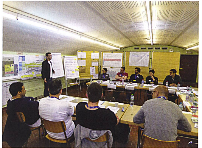
Ci-dessous : Présentation devant l'état-major.

Nous devons utiliser ces formations de conduite, car elles sont uniques dans leur genre. Dommage qu'encore trop de cadres de notre économie ne connaissent pas cette offre et en font usage – cette information-ci doit ouvrir l'avenir.