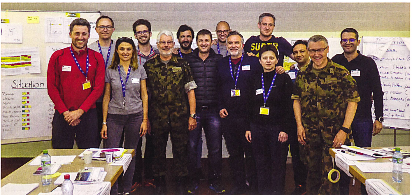
Image de groupe après la conclusion couronnée de succès de l'exercice.

Texte traduit de l'allemand par le cap Gérard Raedler.