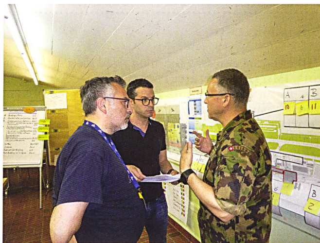
Ci-dessus : Explications par l'instructeur.

L'armée propose une formation au Leadership and Crisis Management dès le début de la formation de chef de groupe. Avec la responsabilité militaire grandissante, augmentent aussi les contenus et les besoins de formation.