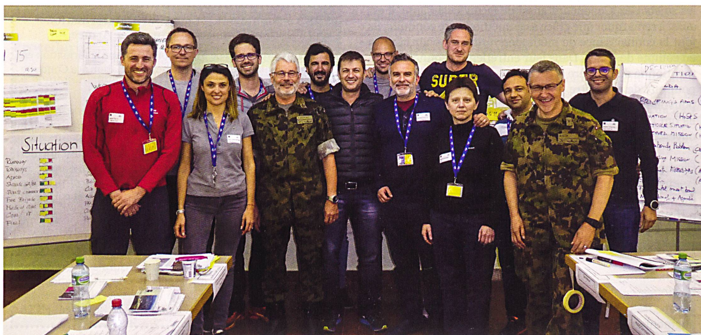
Image de groupe après la conclusion couronnée de succès de l'exercice.

Texte traduit de l'allemand par le cap Gérard Raedler.