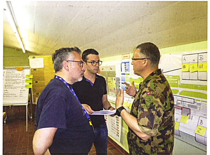
Ci-dessus : Explications par l'instructeur.

L'armée propose une formation au Leadership and Crisis Management dès le début de la formation de chef de groupe. Avec la responsabilité militaire grandissante, augmentent aussi les contenus et les besoins de formation.