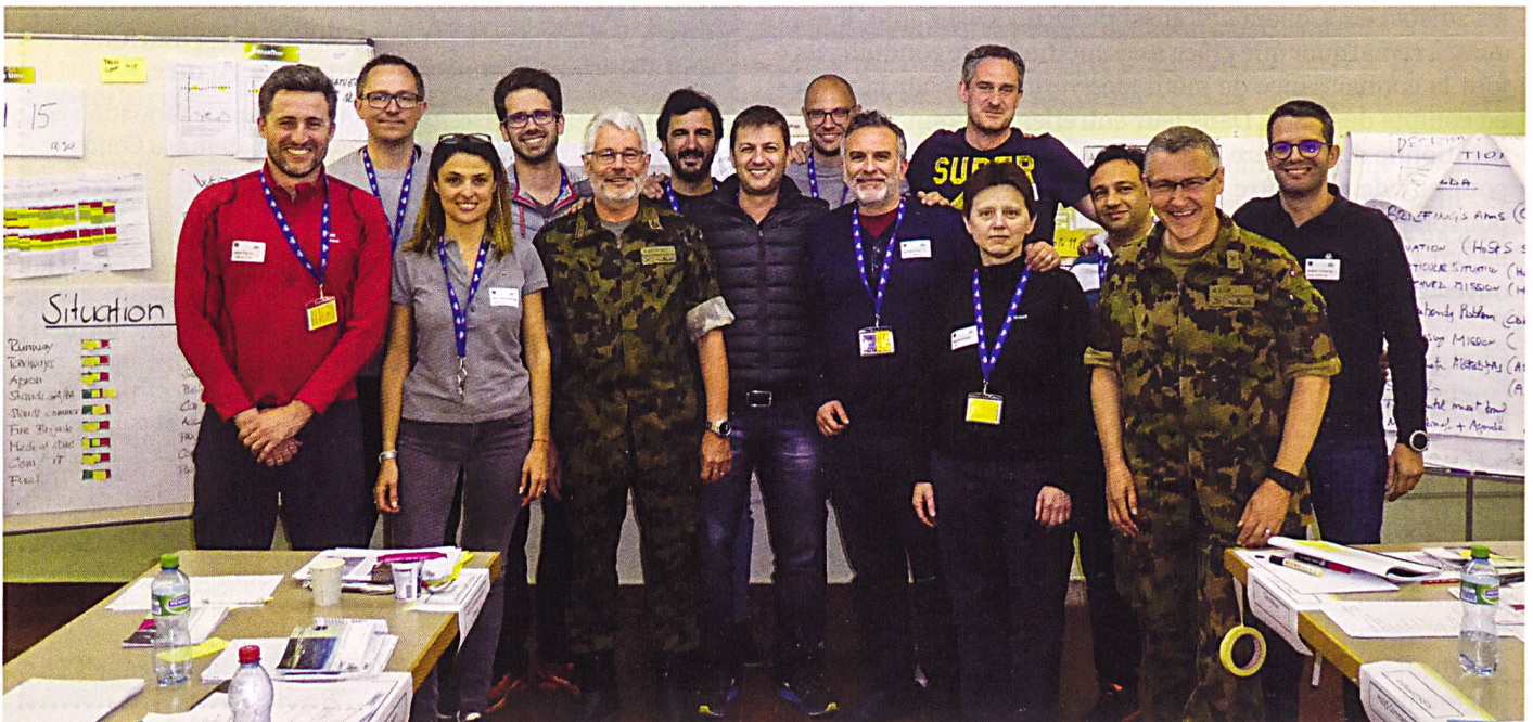
Image de groupe après la conclusion couronnée de succès de l'exercice.

Texte traduit de l'allemand par le cap Gérard Raedler.