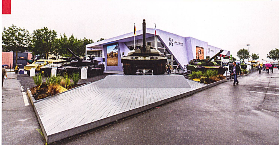
Un stand unique pour KMW et Nexter, un « char européen » entre le Leopard et le Leclerc - Tout un symbole pour l'édition 2018 du salon européen de l'armement.