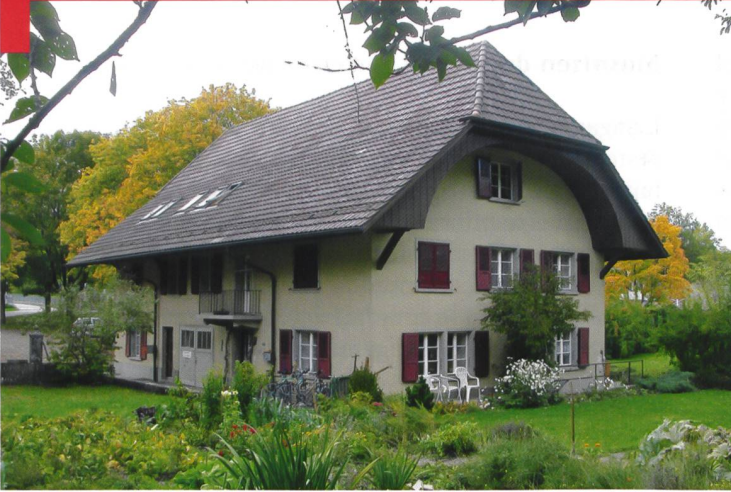
Le PC de la P-26 à Oberburg, près de Berthoud.