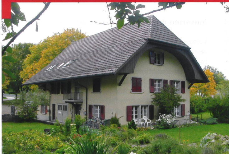
Le PC de la P-26 à Oberburg, près de Berthoud.