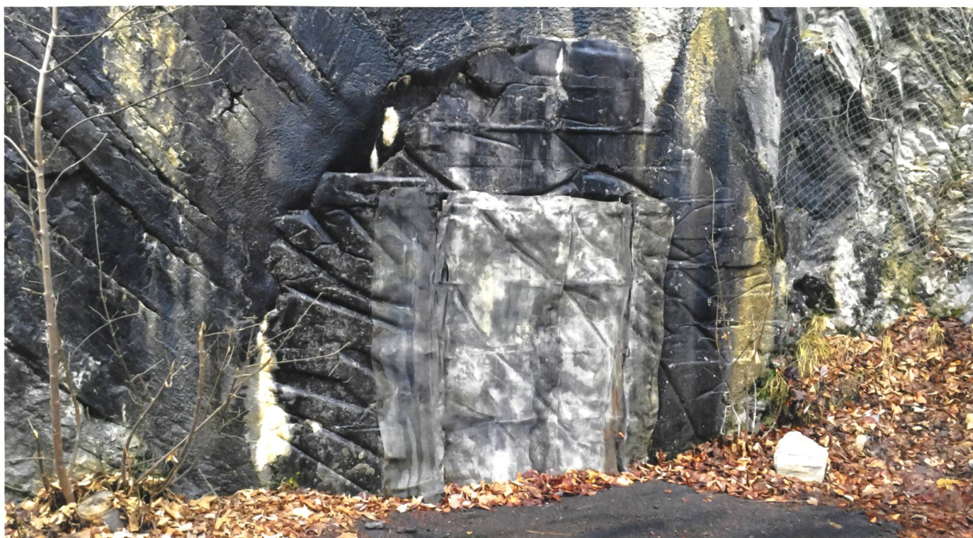
L'entrée du centre de formation de la P-26 à Gstaad.