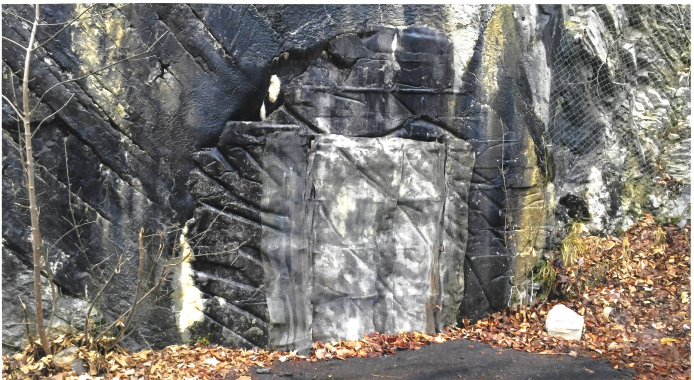
L'entrée du centre de formation de la P-26 à Gstaad.