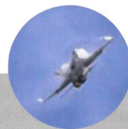
F/A-18 Hornet Solo Display