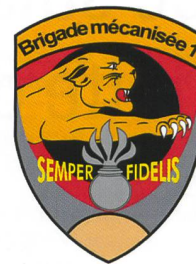
Le capitaine Guyat devant les 800 officiers et invités de la brigade mécanisée 1, le 9 février. Cet article est le résumé de son propos.