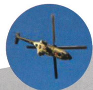
Super Puma Solo Display

RUAG Training Support, partenaire des Forces Terrestres