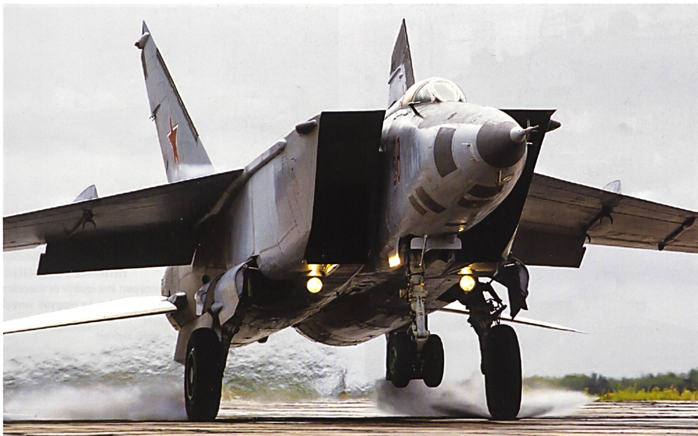
Ci-dessus : La version de reconnaissance du MiG-25RB, aux couleurs de la 2 e escadrille du 47 e régiment de reconnaissance de la Garde (GvORAP). Cette version pouvait emporter des bombes, qui auraient pu être larguées à haute altitude, à une distance de près de 40 km de leur cible. Ainsi larguées, ces dernières auraient été supersoniques en touchant le sol et auraient pu pénétrer 30-40 mètres de terre.