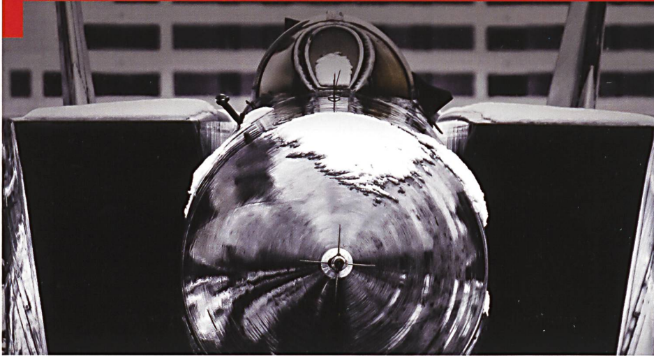
La face menaçante et carrée du MiG-25, immense, contraste avec la plupart des avions-fusées de son temps, à l'image des MiG-21 ou Su-9 beaucoup plus légers.