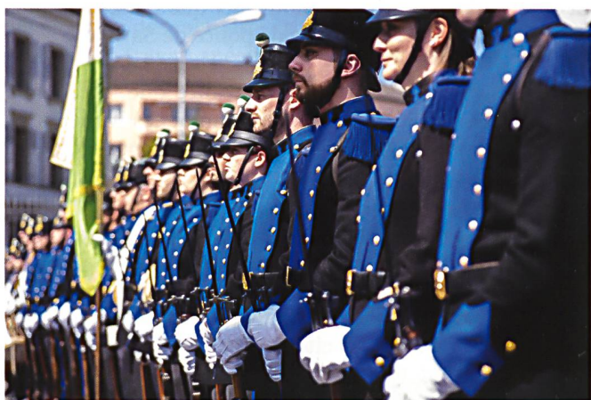
Prestations de serment, à Lausanne.

Dès lors, l'adaptation aux réalités exige une approche et une compréhension globale de la formation. Elle doit prendre en considération des paramètres incontournables tels que, notamment, le sens de l'engagement, la reconnaissance du mérite, la fierté pour un engagement au profit de la collectivité, le réalisme des entraînements, le renforcement des capacités individuelles et collectives, la maîtrise de soi et la cohésion. Que de valeurs !