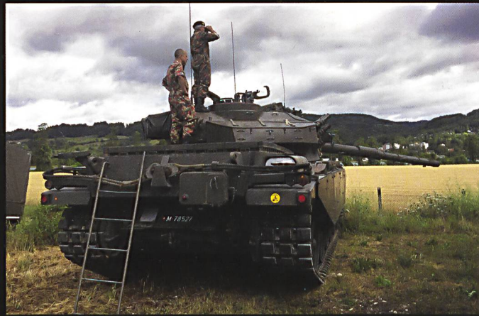
Une silhouette familière : le char 55 Centurion équipé du simulateur de tir « solartron. »