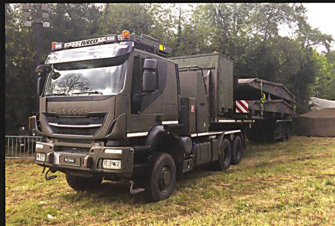
Comme dans le cas du char pont 68, des éléments de ponts supplémentaires peuvent être acheminés par camion. Ci-dessous : A Full, de nombreux prototypes de la société Mowag sont exposés en sous-sol.