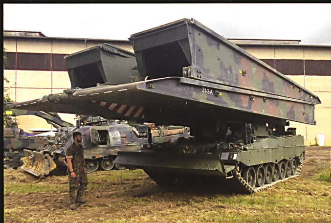
Le nouveau char poseur de ponts a été présenté au public. Ci-dessous : La silhouette bien connue du char 68, ici à tourelle étroite, contraste avec celle du T-72.