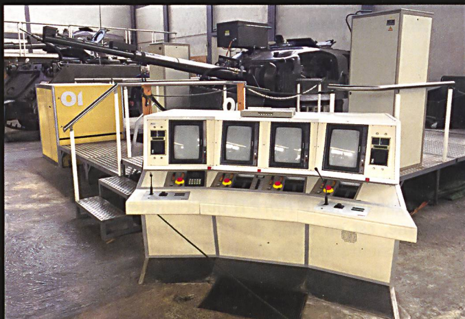
Le simulateur de tourelle de Centurion a été adapté à son nouvel emploi, à partir des années 1990, en tant que bunker antichar.