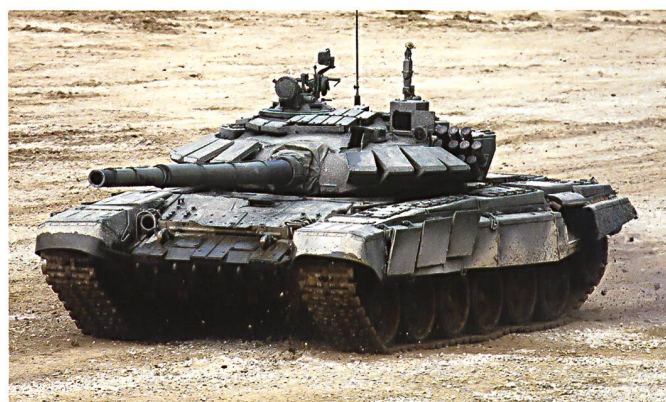
Démonstration d'un T90A russe.