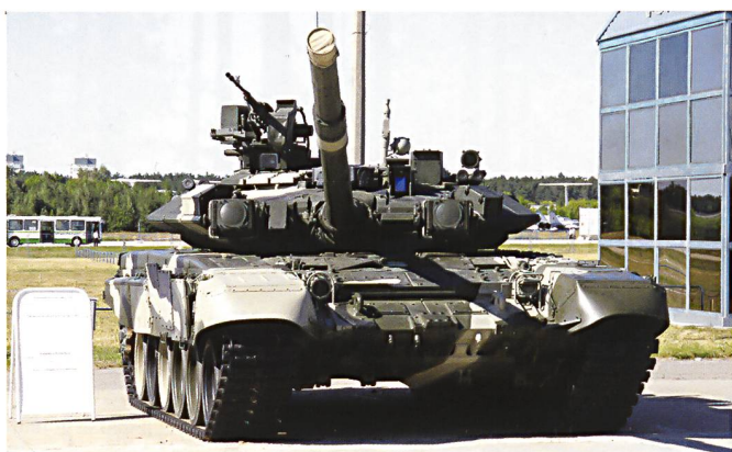
Le T90A est reconnaissable à ses blindages supplémentaires, ses brouilleurs de part et d'autre de la tourelle, ainsi qu'un affût de mitrailleuse pointant vers l'avant.