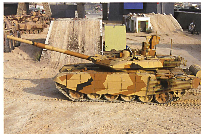
Ci-dessus et ci-dessous : Le T90SM ou MS est le dernier modèle proposé à l'exportation.