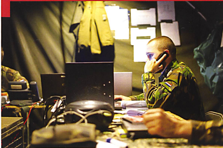
Toutes les illustrations : Le travail au sein du poste de commandement de la 43 e brigade néerlandaise. Voir article page 40.