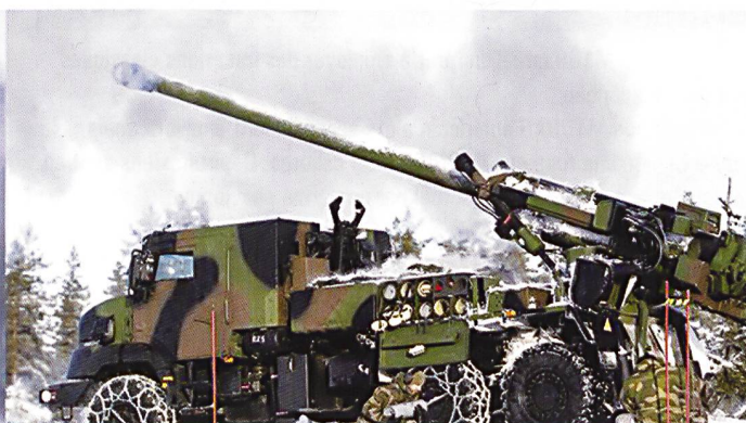
Les quatre concurrents à une série de tests de tirs réels en Norvège, 2015 : Panzerhaubitze 2000 allemand, K-9 coréen, M109 KAWEST helvétique et Caesar français.

tonnes. Ceux-ci ont été conçus durant les vingt dernières années où l'effort principal de la Marine américaine a été la surveillance et l'action contre les zones côtières.