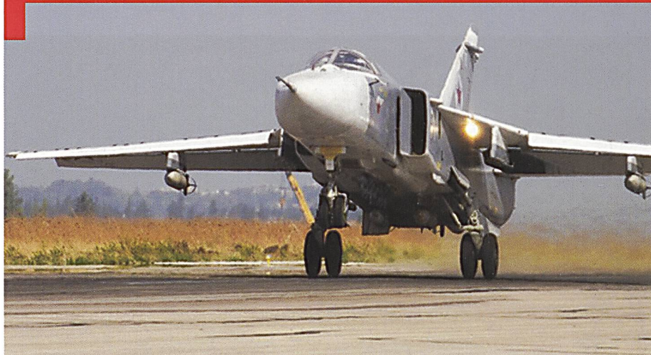
Un bombardier Su-24 Fencer au décollage.