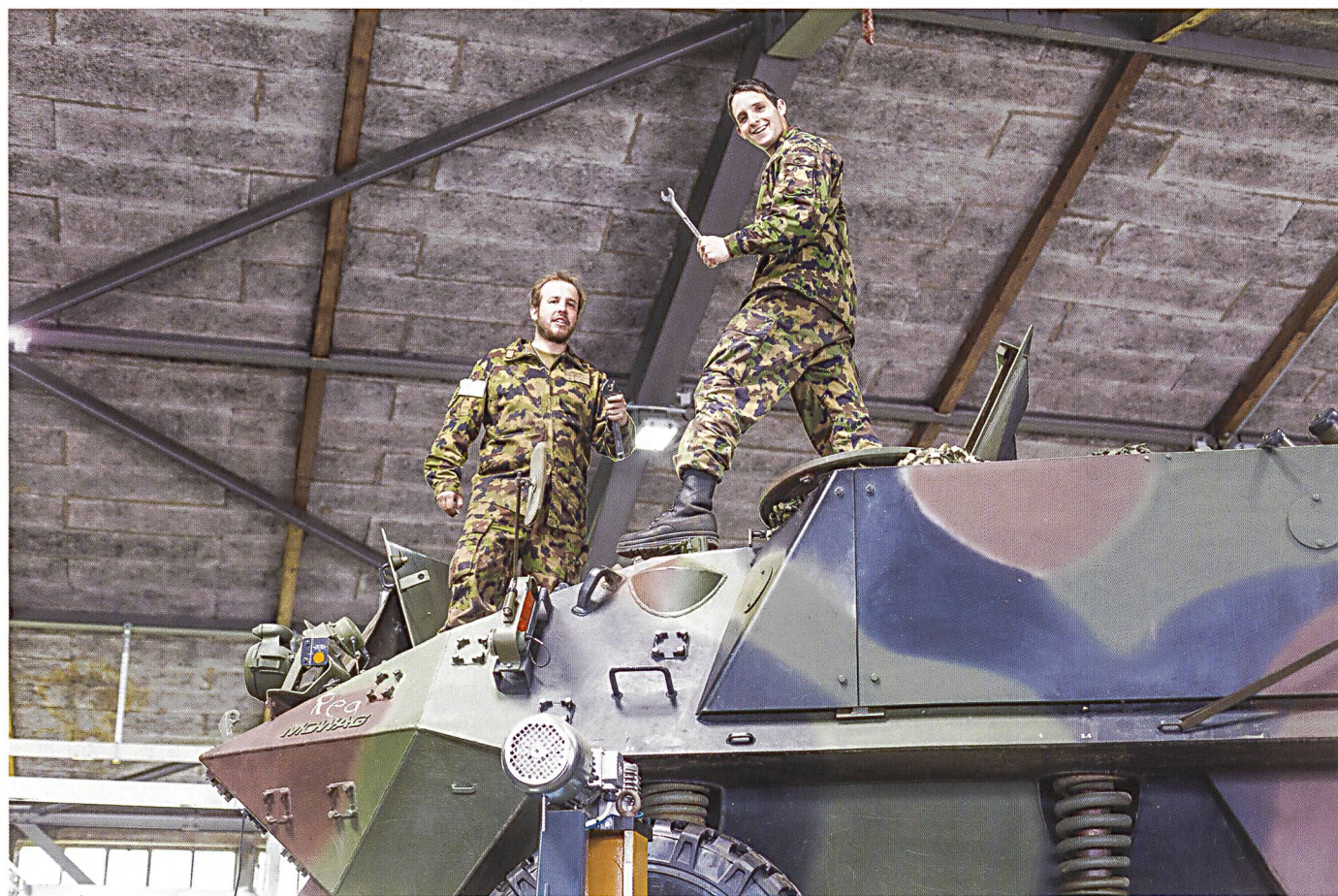
Un Piranha révisé par la maintenance.

Depuis 2012, les exercices d'EM et de compagnies du bat log 21 ont été réalisés en partenariat avec le CLA-G en trois phases: mobilisation, démobilisation, et, entre les deux, conduite de l'action, durant laquelle le bat log 21 adapte son rythme pour rendre possible un soutien logistique dans la durée. Il s'agit de renforcer les structures existantes et de leur permettre d'augmenter la