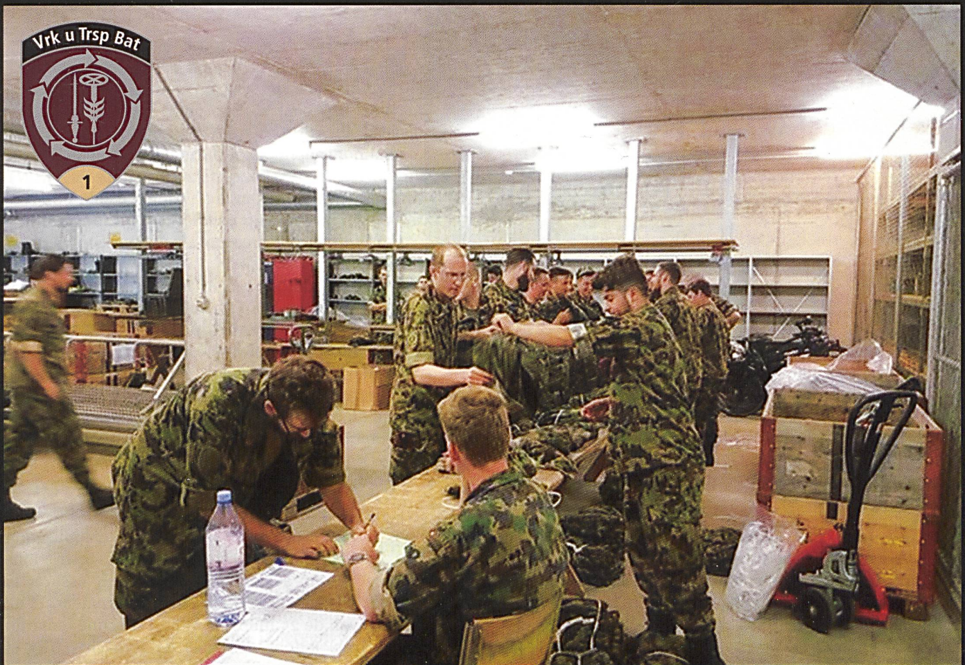
Le bataillon de circulation et transport 1 (VT Bat 1) appuie la Base logistique de l'armée ainsi que les autorités civiles dans le cadre d'engagements subsidiaires. Ce corps de troupe à disponibilité élevée peut être mobilisé rapidement. Il a été engagé notamment pour l'appui de la Fête de la lutte à Estavayer, durant son cours de répétition en été 2016.