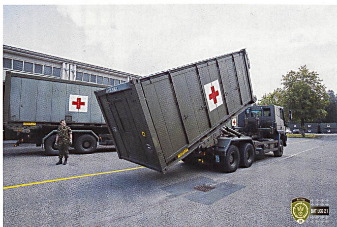
Ci-dessous : Mission de transport de containers sanitaires.