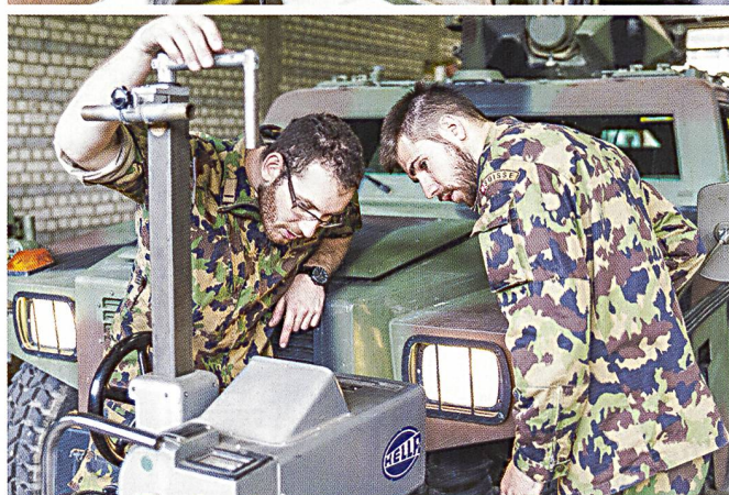
Ci-dessus : La maintenance au travail.