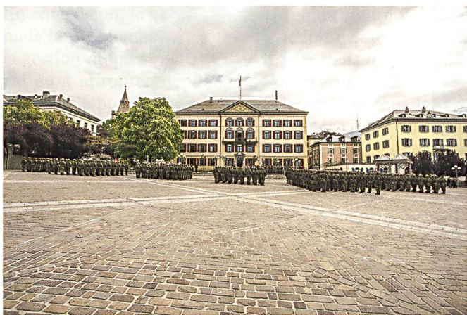
Le sentiment du devoir accompli, le bat car 1 remet son drapeau.