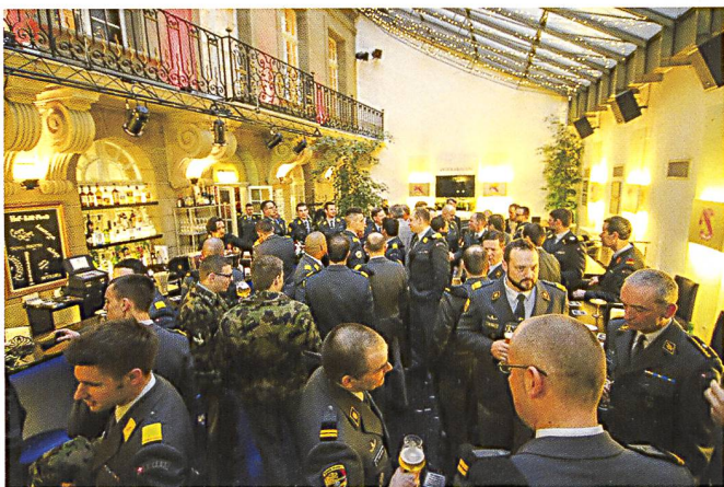
Cent participants pour fêter les 15 ans de l'OG Panzer, au restaurant Zum Äusseren Stand, Zeughausgasse 17, à Berne. La prochaine assemblée générale aura lieu le 9 mars 2017 au même endroit.