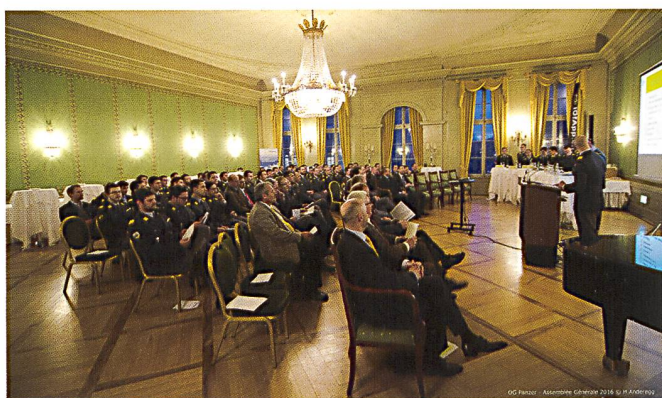
Le vice-président, cap Erich Muff, devant une salle comble.