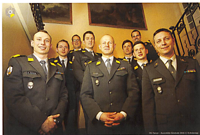
Un comité jeune, motivé et renforcé, pour organiser une dizaine d'événements à travers toute la Suisse.