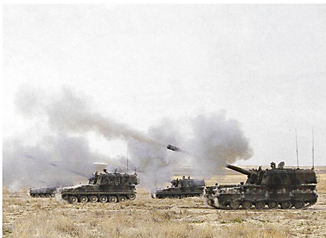
Les opérations militaires turques se déroulent à proximité de la frontière, sous une couverture constante d'unités de feu, à l'instar de ces obusiers blindés.

arabes et les turkmènes de quitter leurs maisons pour changer la population et créer une zone ethniquement homogène, en menaçant aussi les kurdes qui ne soutient pas son agenda secret.