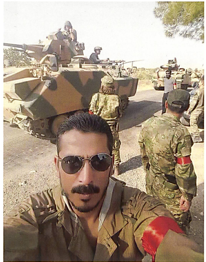
L'ACV-IS est le nom turc de l'YPR 765 - un M113 amélioré.

Même si l'opération se déroule en conformité avec les normes du droit international, certains médias changent les commentaires des officiels turcs. Même si le Premier ministre turc Binali Yıldırım, le Président Recep Tayyip Erdoğan et le chef de la diplomatie turque Mevlüt Çavuşoğlu cible le YPG, le mot YPG est interprété comme les kurdes 15 .