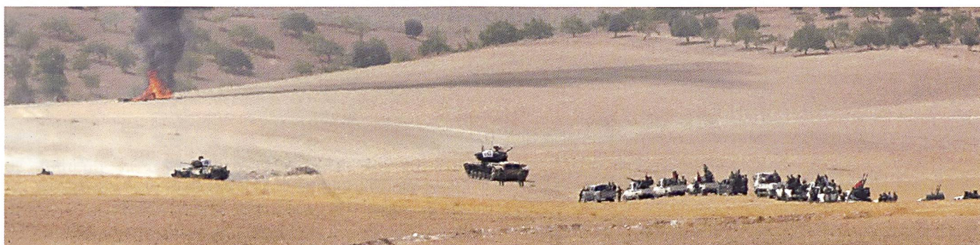
Une section de M60 constitue l'avant-garde d'une formation hybride. Cette dernière s'apprête à prendre d'assaut le village de Jublas - sous les caméras du monde entier.

dirigée par les Etats-Unis est d'éradiquer seulement l'organisation terroriste Daech, non pas le YPG, qui n'est pas considéré comme une organisation terroriste par les Etats-Unis et la plupart d'autres pays. La Turquie, face à deux organisations terroristes – le Daech et le YPG – en Syrie, se sent humiliée par ses alliés occidentaux. Les intérêts nationaux ne correspondent pas à ce point.