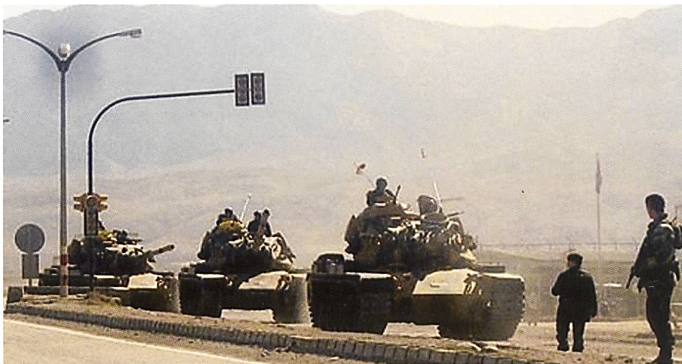
Une section de M60 turque franchissant la frontière avec la Syrie. Conçu à la fin des années 1950, cet engin de 54 tonnes existe en diverses étapes d'améliorations. La plupart disposent désormais de blindages réactifs pour se protéger des armes antichars à courte ou à moyenne portée.

une réaction juste d'Erdoğan : « Bien que nous les ayons informées que cet individu était un combattant terroriste étranger, les autorités belges n'ont pas été en mesure d'identifier ses liens avec le terrorisme. 9 »