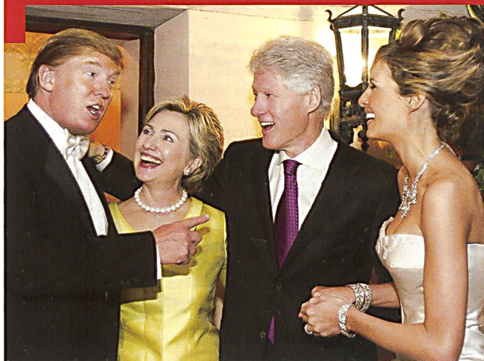
Donald Trump et Hilary Clinton : Anciens amis devenus ennemis de circonstance ?