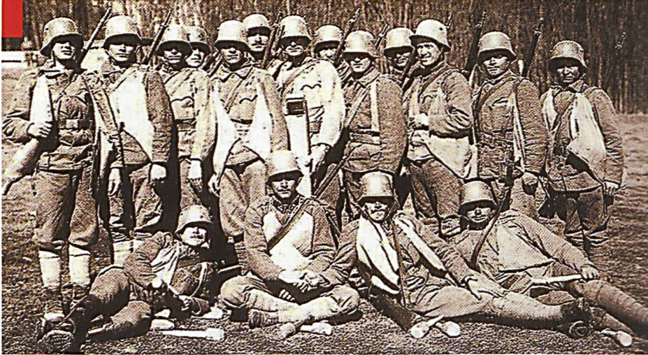
Un groupe de combat des Stosstruppen allemands photographié en 1917