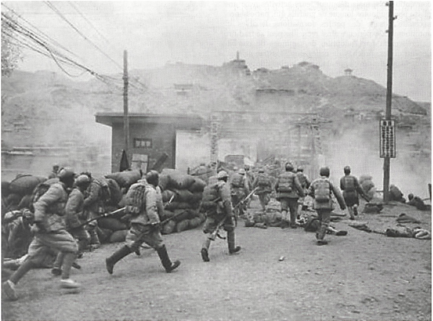
Août 1949, les forces communistes sont sur le point de mettre fin à la guerre civile chinoise après trois années durant lesquelles elles se montrèrent bien supérieures à une armée nationaliste pourtant mieux équipée.

alors contre elle. La 15 e armée japonaise s'immola ainsi littéralement contre les bastions britanniques à Imphal et Kohima en 1944.