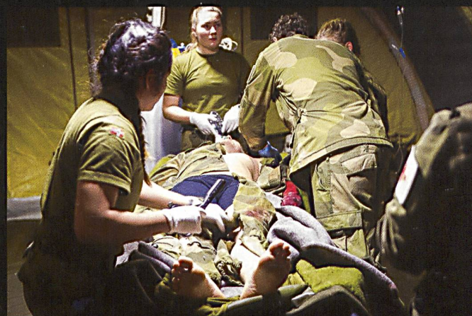
Ci-dessus : L'entraînement de la chaîne sanitaire est également une partie intégrale de chaque situation de l'exercice. Ci-dessous : Le corps des Marines américain dispose en Norvège de matériels pré-positionnés, à l'instar de ces Hummers .