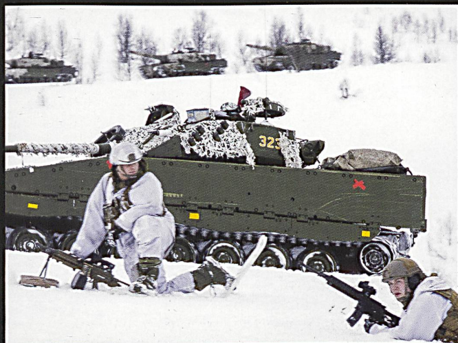
Les bataillons mécanisés norvégiens sont équipés de chars de grenadiers CV9030 – très similaires aux engins helvétiques.