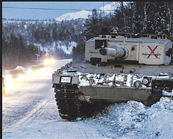
Un Léopard 2A4 norvégien observe et appuie un contrôle routier à distance de sécurité.