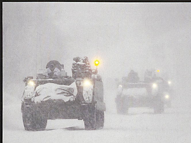
Comme dans beaucoup d'armées, le vénérable M113 n'est pas encore totalement remplacé.