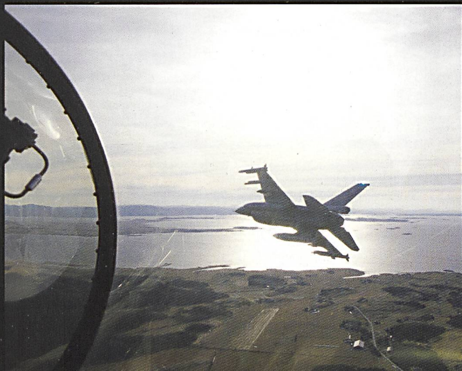
La défense aérienne au-dessus de la zone de manœuvre est assurée par des F16 norvégiens ainsi que des F15 américains, déployés à proximité de la frontière russe.