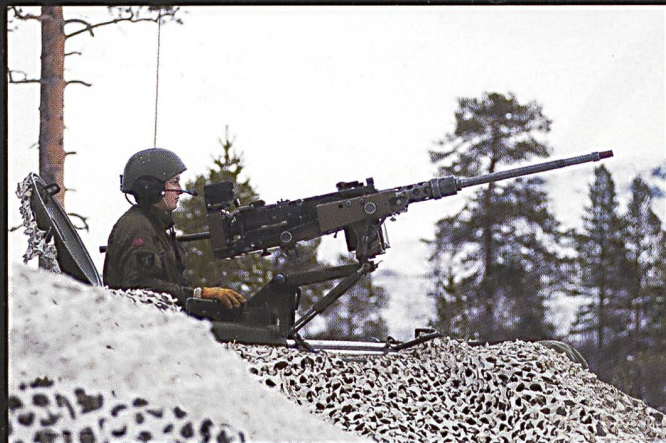
Les engagements dans des conditions climatiques extrêmes nécessitent un entraînement et un équipement adéquats.