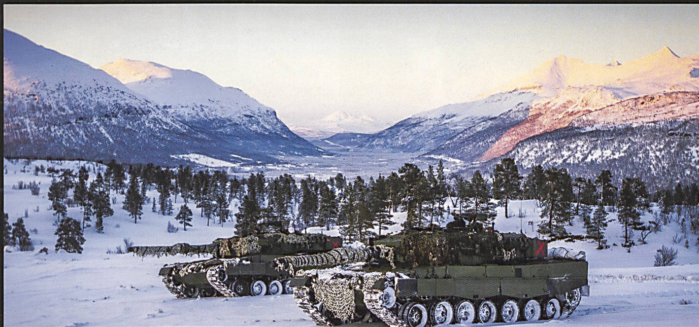
Deux Léopards norvégiens, photographiés durant COLD RESPONSE 2014. Vous trouverez d'autres illustrations de l'engagement des forces norvégiennes et suédoises lors de COLD RESPONSE dans RMS No. 3/2016.